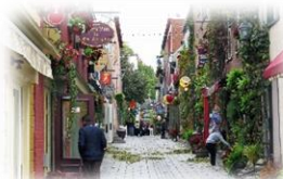
カナダ ケバック旧市街