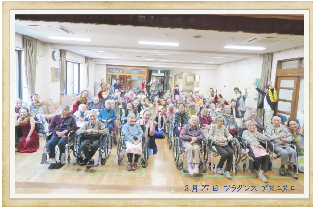
3月27日 フラダンス アヌエヌエ