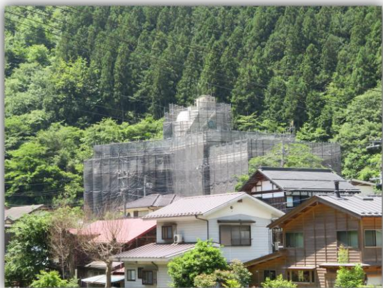
桧原サナホーム大規模修繕工事の外観