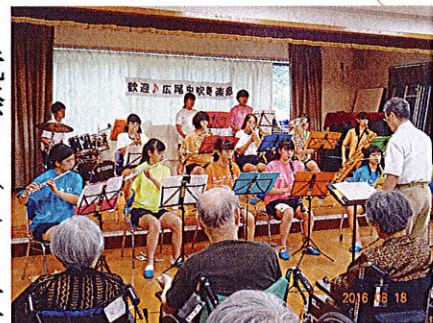
迫力があるねー ほんものは! 来年もぜひお願いしたいです