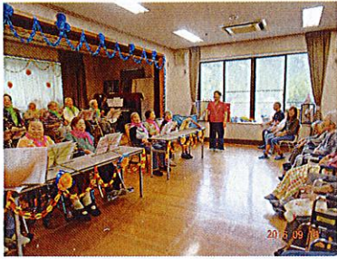
さあ、みんなで大きな声 でララララー