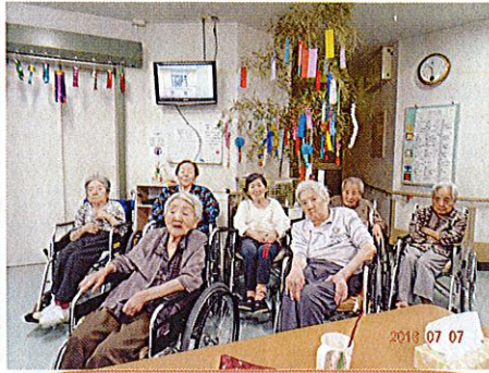
女性だけではなくご利用者様全員で楽しみました