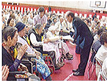
村でもお祝いして いただきました！ おめでとうございます