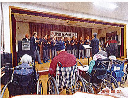
毎回毎回楽しい音楽ありがとうございます。