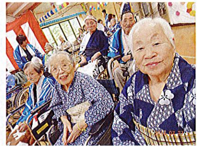
みんなで元気にサツサのサ