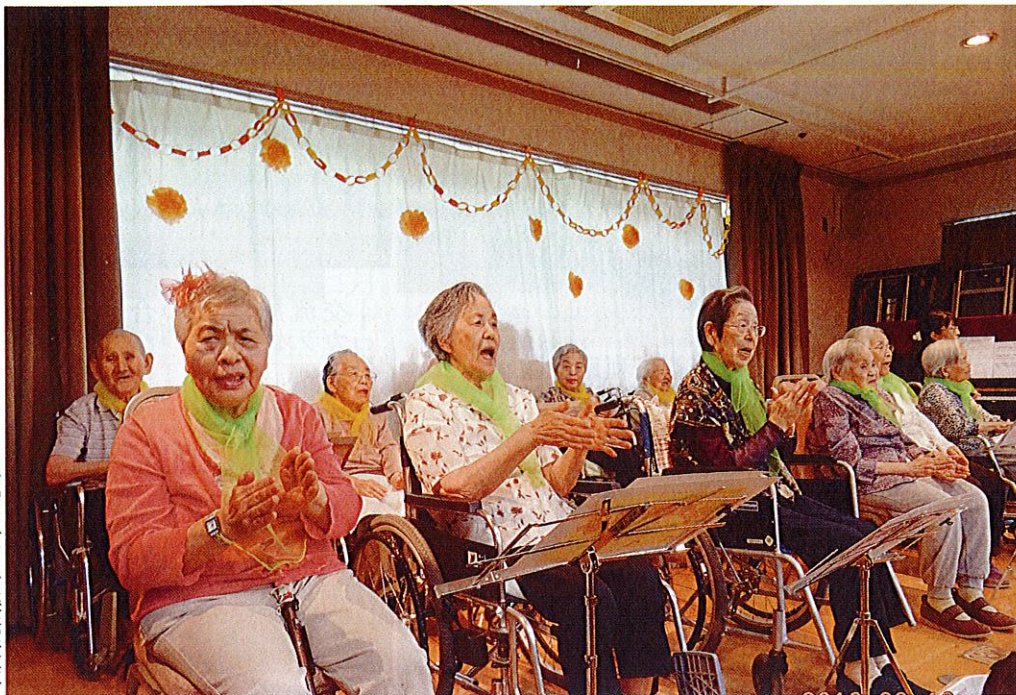
(九月十日音楽発表会)