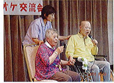
交流施設との合同カラオケ会