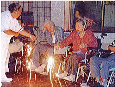
まぶしいけど きれい!