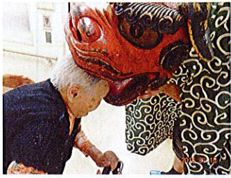
あちらでガブリこちらでガブリ・ガブリ・ガブリ健康祈願