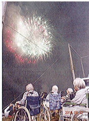
いつもきれいでうっとり \(\ ^\circ\ ^\circ\) /