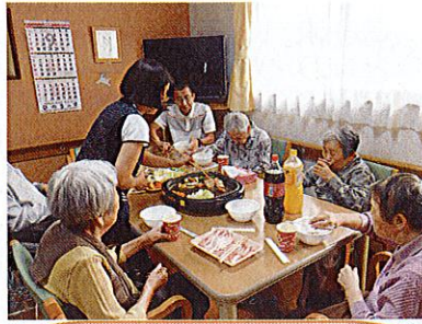
おなか一杯食べました ご馳走様！