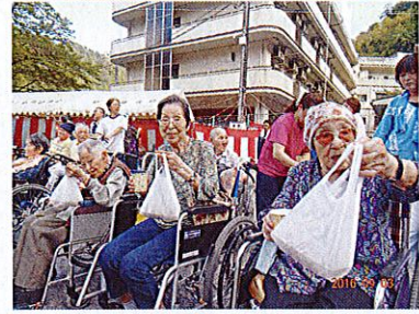
郷土芸能と屋台が一緒に 楽しめました！