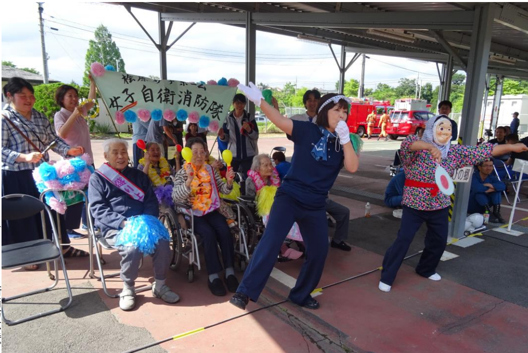
(6月9日自衛消防応援)