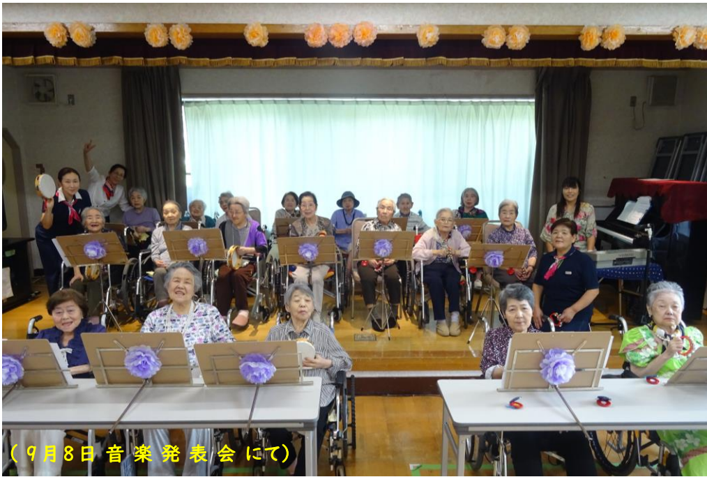
(9月8日音楽発表会にて)