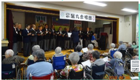
夕涼み会 (8月15日、22日、30日)