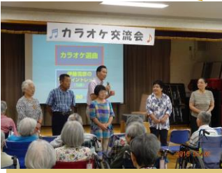
カラオケ交流会 (7月8日)